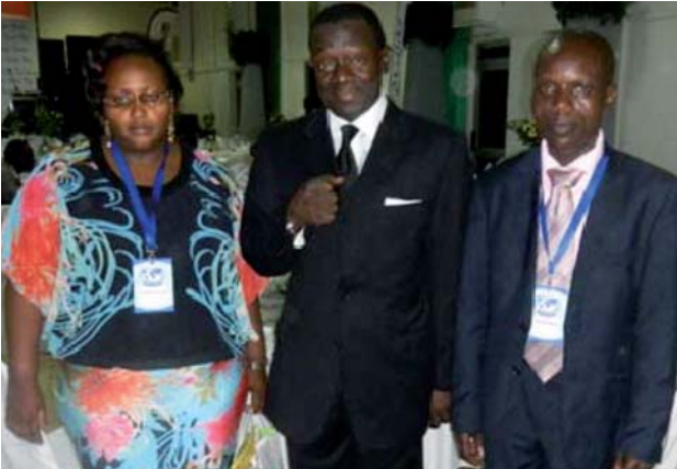
Delegazione WUSME/ASOL / Delegación WUSME/ASOL